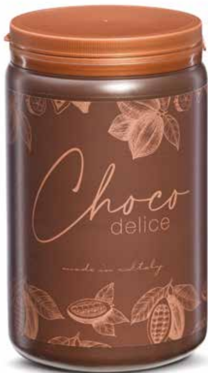
PM010 Barattolo di cioccolata Choco Delice da 1 kg. Choco delice 1 kg. tin