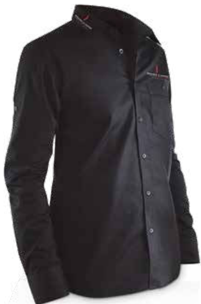
PR094 Camicia. Shirt.