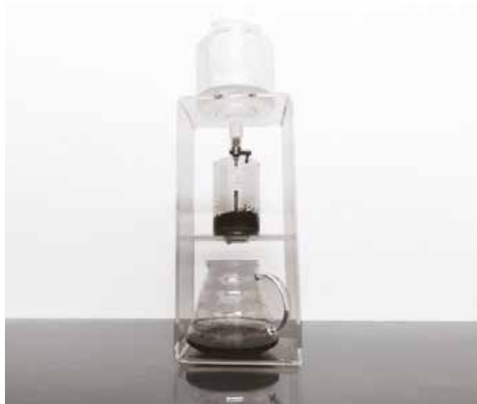
Estrazione filtro a freddo Cold brew extraction