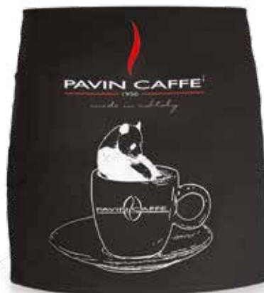
PR082 Traversa corta Panda. Panda short Apron.