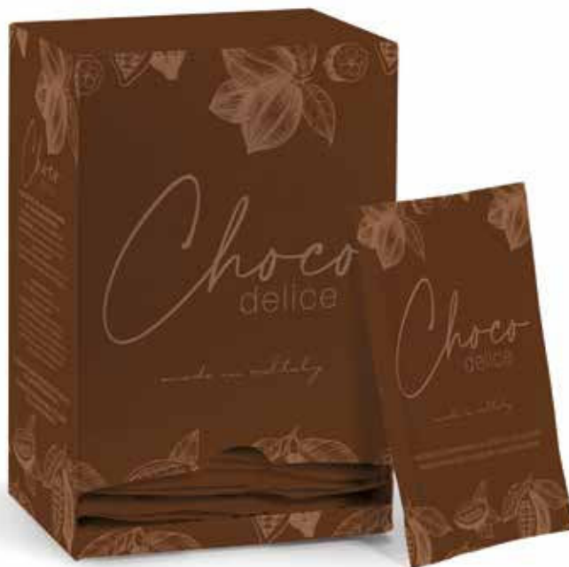
PM020 Cioccolata Choco Delice confezioni da 30 monodosi da 25 gr. Choco Delice in box of 30 monodoses of 25 gr.