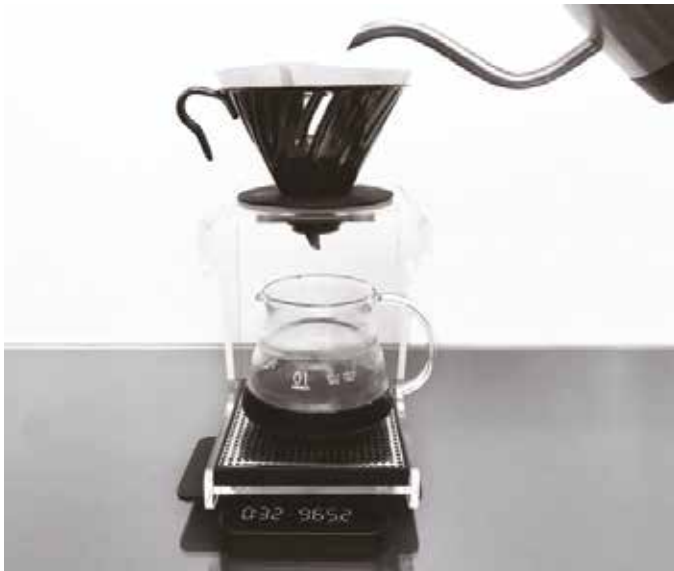
Estrazione filtro a caldo Hot filter extraction