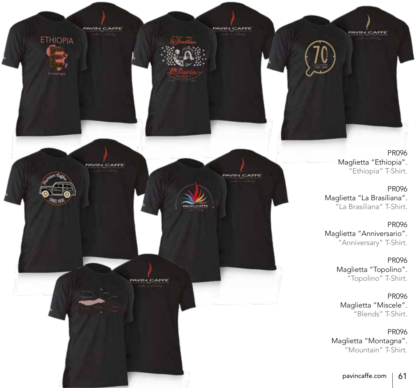
PR096 Maglietta "Ethiopia". "Ethiopia" T-Shirt.