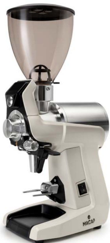
LABO 70D - R