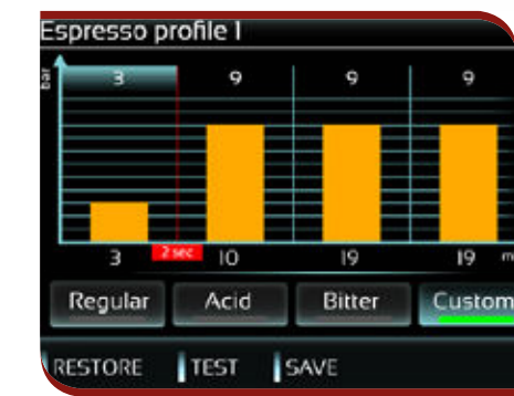
Brewing pressure profile system