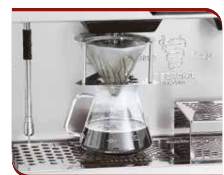
Drip coffee brewing