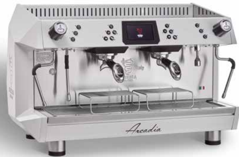
ARCADIA BREWING PROFILE TOTAL WHITE