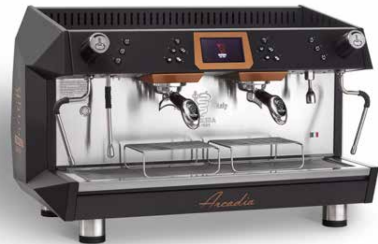
ARCADIA BREWING PROFILE TOTAL BLACK