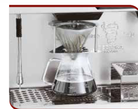
Drip coffee brewing